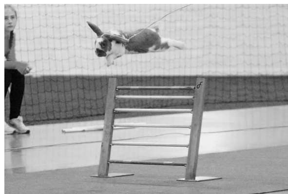
Regnbågens Sensation for Life "Freddie"