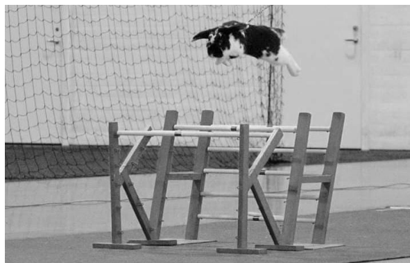
Flammans Pineapple Twist "Todd"