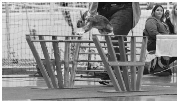
Silverados Nico Starlight "Lysa"

Tack Hälsinge Kaninhoppare för ett bra arrangemang och tack för en oerhört rolig helg Freija och Embla!