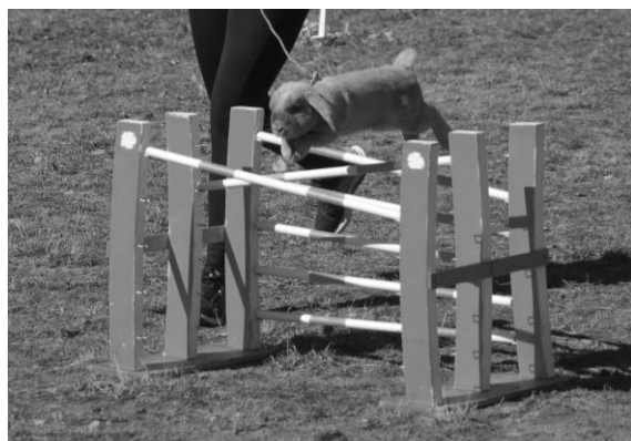
Shadow Rain "Neo"