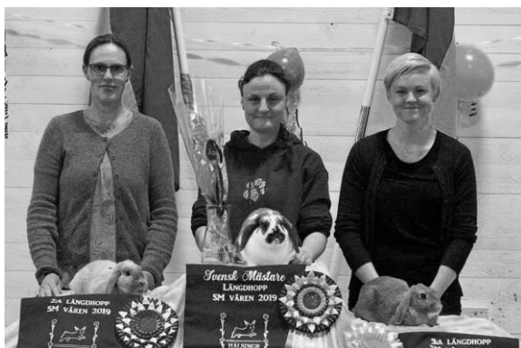
Pallen i Längdhopp